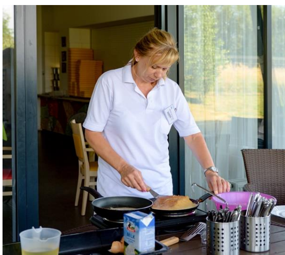
Smažení palačinek na terase