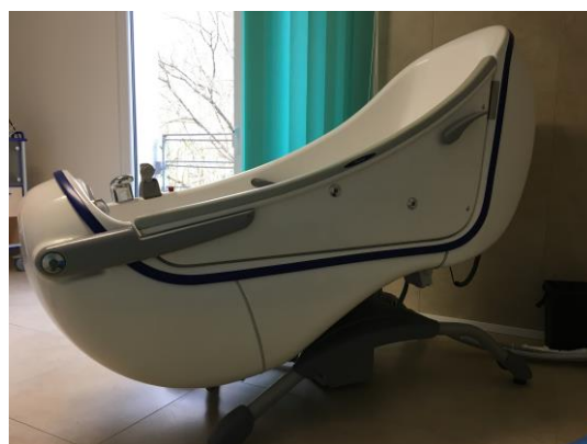
Polohovací vana v balneo místnosti