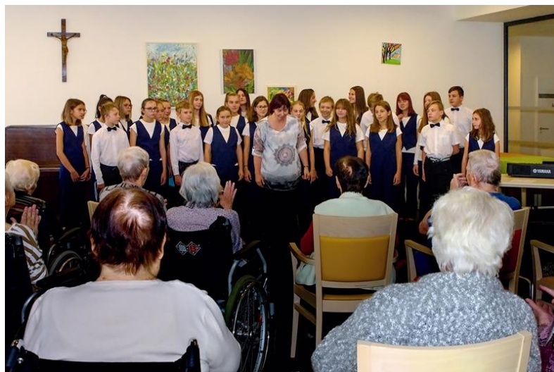
Dětský pěvecký sbor Rozmarýnek