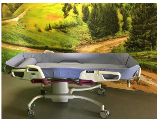
Nově zakoupené mobilní koupací lůžko Carevo

Naše vize je dlouhodobější, určitě ji nenaplníme hned, ale v tomto roce uděláme důležité kroky. O všech cestách, úspěších a neúspěších Vás budeme i tímto způsobem informovat.