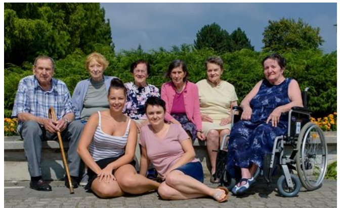
Plnění ročních přání

V letošním roce navážeme spolupráci se širokým okolím, spolky a ostatními zájmovými sdruženími v okolí domova, se školami a školami a dalšími institucemi s jedním cílem. Chceme do našeho domova přivést ostatní lidi, jejich život a koníčky, aby u nás trávili svůj volný čas, vzdělávali se nebo jinak potkávali. Chceme tomu říkat komunitní centrum a chceme se potkávat "mezigeneračně". To všechno má jediný smysl – přivést do domova život, využít naše možnosti pro ostatní lidi z okolí a využít zajímavé programy pro naše klienty, být součástí komunity, být součástí Šumbarku a města.